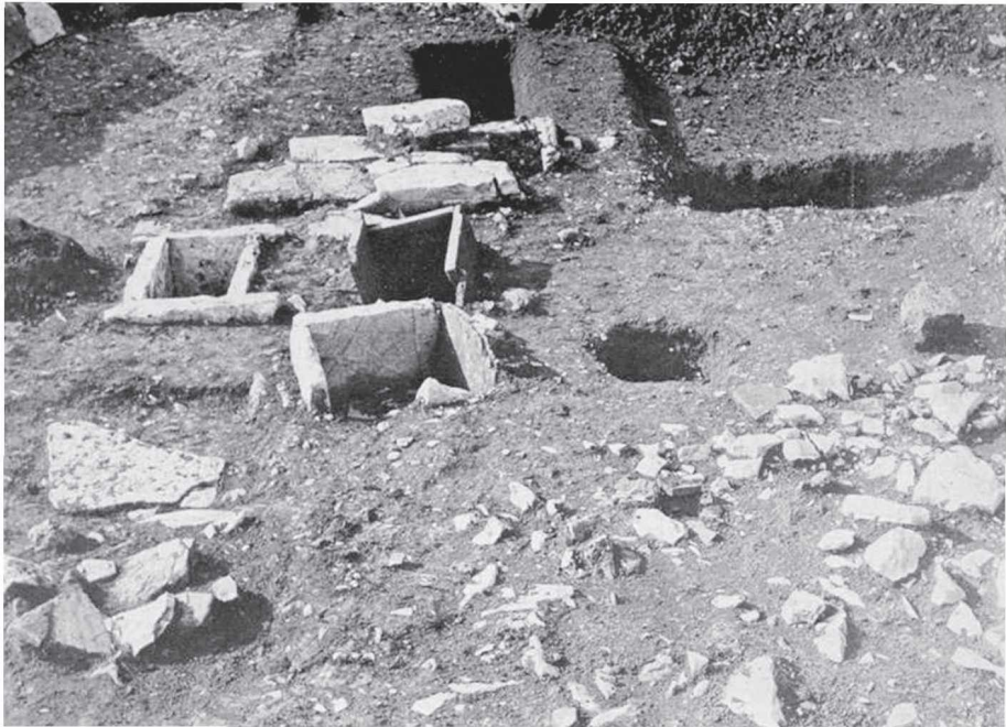
Εικ.1 α, β: Τμήματα του νεκροταφείου