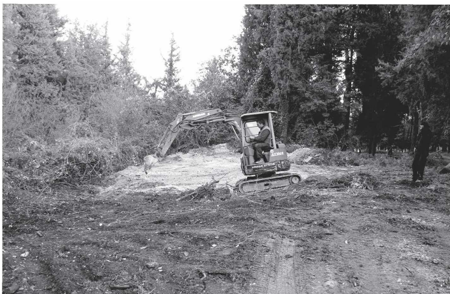
Εικ. 5 α, β: Απομάκρυνση σύγχρονων αποθέσεων (μπάζων) από την περιοχή του βορείου συγκροτήματος