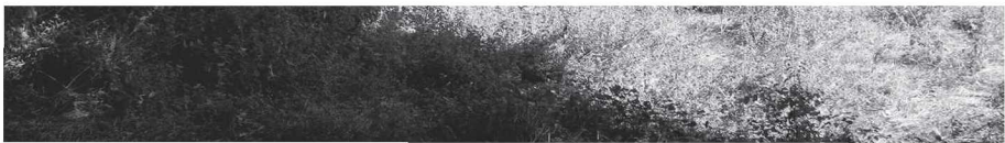
Εικ. 6 α, β: Η σταθερή περίφραξη του νοτίου συγκροτήματος