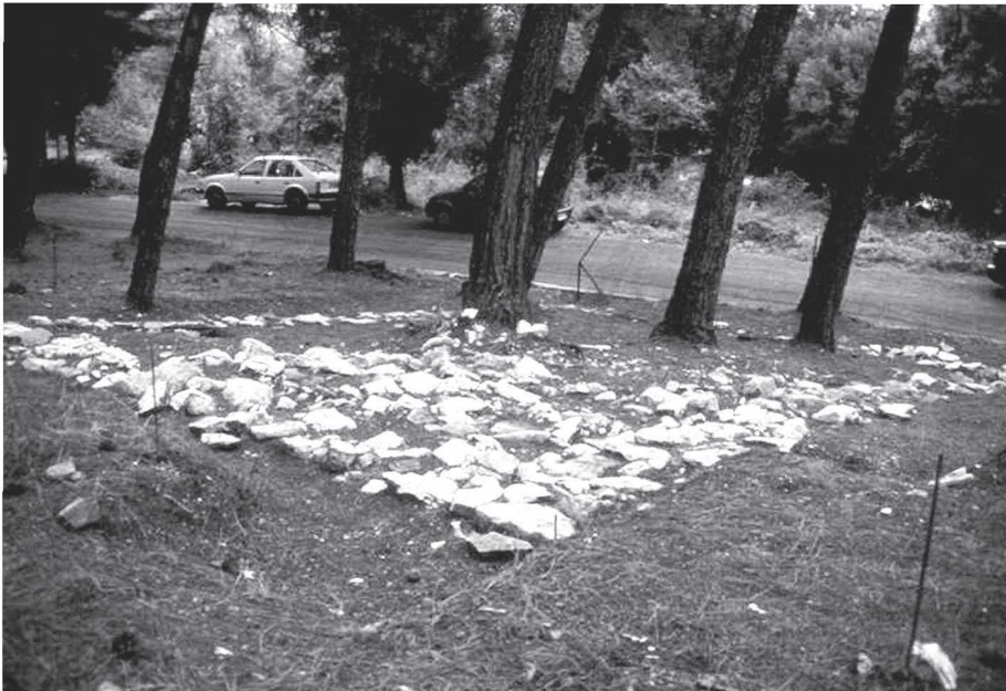
Εικ. 3 γ, δ: Ορθογώνια κτίσματα στο νότιο συγκρότημα