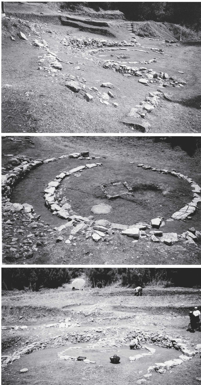
Εικ. 2 α, β, γ: Το θεσμοφόριο στο βόρειο συγκρότημα