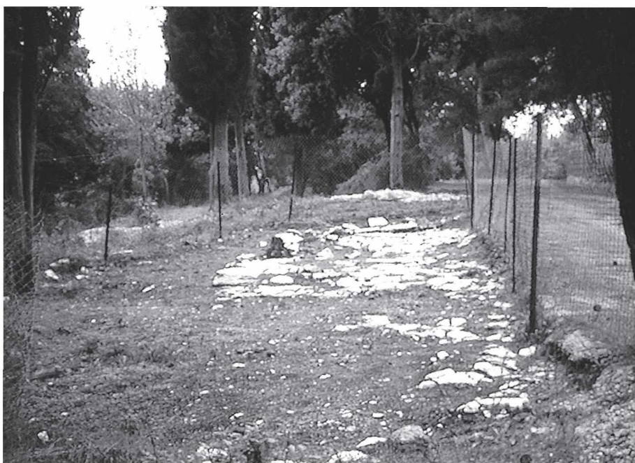
Εικ. 3 α, β: Το κυκλικό πλακόστρωτο στο νότιο συγκρότημα