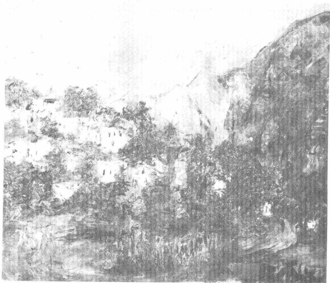
Δημοσθένη Κόκκινου: Νεράϊδα Τρικάλων. Μερική θέα. (Έλαιόλαδο).