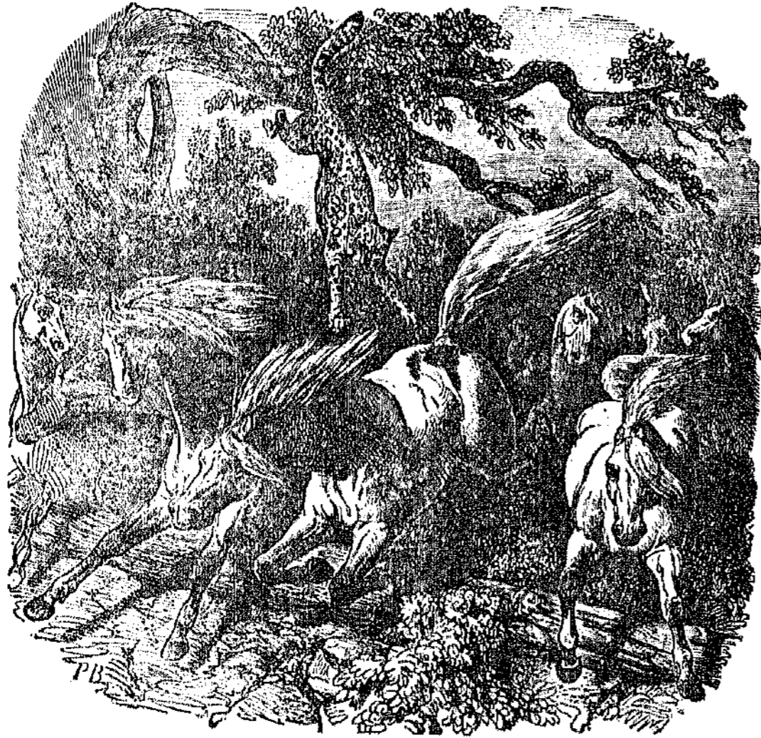
Τίγρις ὁρμῶσα καθ' ἵππου.

δεξιότητος. Ὅλοι αἱ φορβιάδες παρατάσσονται κυκλοτερώς, ἔχουσαι τὰς μὲν κεφαλὰς πρὸς τὸ κέντρον ἵπου ἐτέθησαν οἱ πόλοι, τοὺς δὲ πόδας πρὸς τὸν ἔξωτον, ὥστε ν' ἀντιλακτίσωσιν αὐτὸν ἐν τολμῆσιν νὰ πλησιάζῃ, ἐνῶ ὁ ἀτρόμητος ἀρχηγὸς μένει ἐκτὸς τοῦ κύκλου, και περιφέρεται ἐπιβλέπων τὰ ἀσθενέστερα μέρη και βοηθῶν αὐτά. Αὐτὸς ἀρκινδυνεύει πλέον τῶν ἄλλων, και κατ' αὐτοῦ συνενοῦσι τὰς δυνάμεις των τὰ θηρία. Ἰσπανίως οἱ λύκοι κατορθοῦσι νὰ διασπάσωσι τὰς τάξεις ταύτας, και διὰ τοῦτο ἐνεδρεύοντες ὁρμῶσι κατὰ τῶν ἵπων δοξαίως