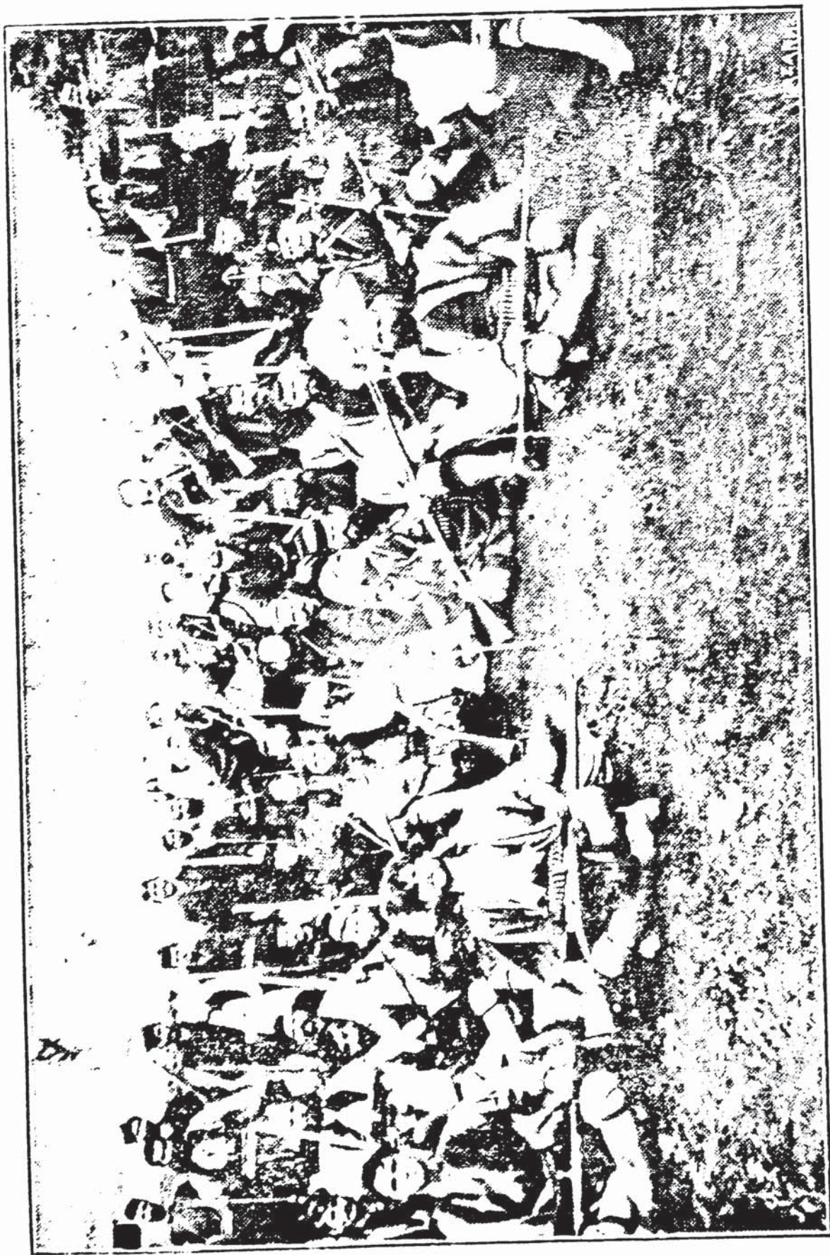
Ο ΛΙΤΣΑΣ ΜΕΤΑ ΤΩΝ ΠΑΛΛΗΚΑΡΙΩΝΙΣΤΟΥ