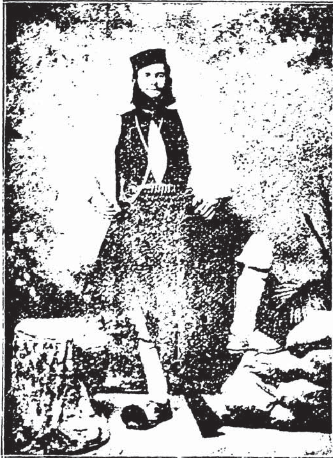
Ο ΚΑΠΕΤΑΝ ΛΟΥΚΑΣ ΚΟΚΚΙΝΟΣ

Ἐκ τῆς εἰσόδου τοῦ Λίτσα εἰς τὰ Καστανοχώρια ἀρχεται τὸ δεύτερον στάδιον τῆς ἐν Μακεδονίᾳ δράσεώς του, ἣτις ἐπέπρωτο νὰ κλείσῃ μὲ τὸν ἡρωϊκὸν θάνατον αὐτοῦ καὶ τῶν ἐπιλέκτων ὀπαδῶν του. Ἀπονέμων δικαιοσύνην καὶ ἀσφάλειαν εἰς τοὺς χωρικοὺς δὲν ἔπαυεν ἐν ταυτῷ νὰ συντρέχῃ καὶ τὰ