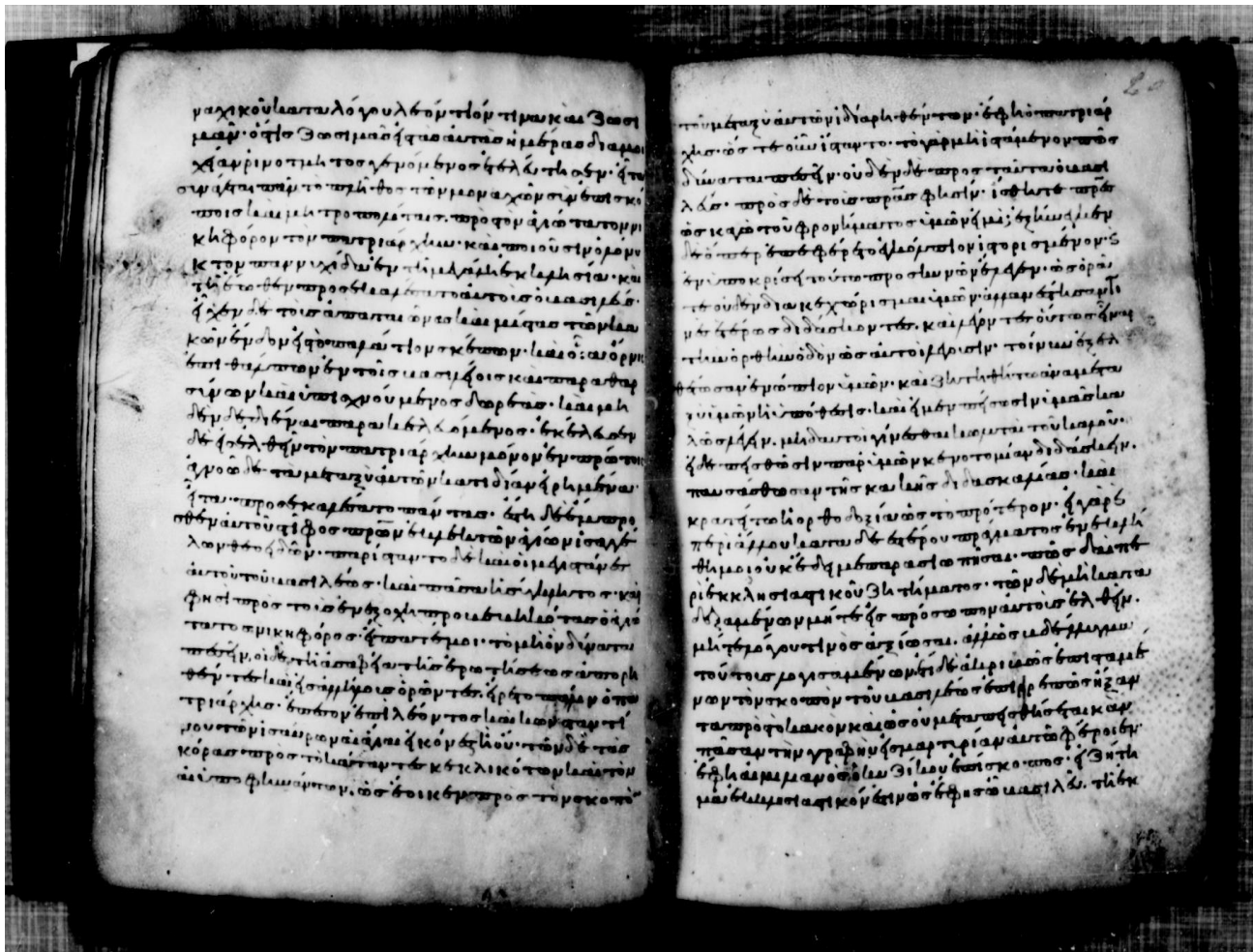
Κώδικας Μεγίστης Λαύρας Γ24, 264