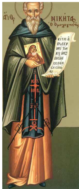
Όσιος Νικήτας ο Ομολογητής