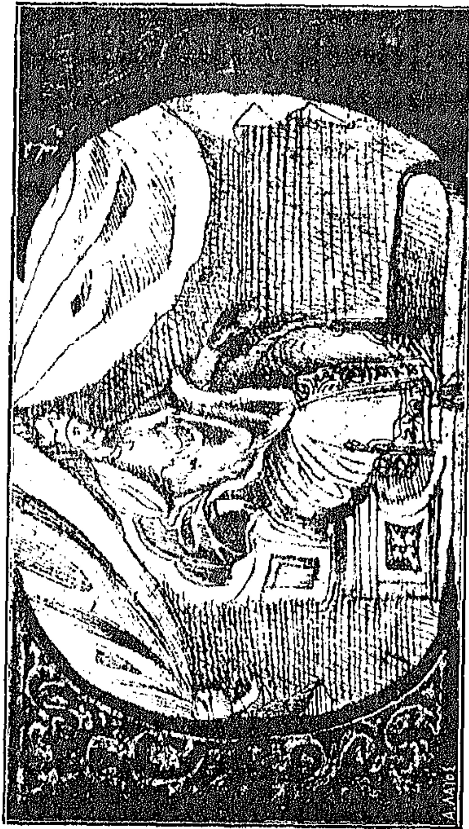
ΣΥΓΡ. Π. ΛΑΜΠΡΟΥ. ΝΕΟΣ ΕΛΛΗΝΟΜΝΗΜΟΝ ΤΟΜ. Γ'

ΚΩΝΣΤΑΝΤΙΝΟΣ Ο ΠΑΛΑΙΟΛΟΓΟΣ ΚΑΤΑ ΤΟΝ ΚΩΔΙΚΑ ΤΟΥ ΚΛΟΝΤΖΑ ΕΝ ΒΕΝΕΤΙΑΙ