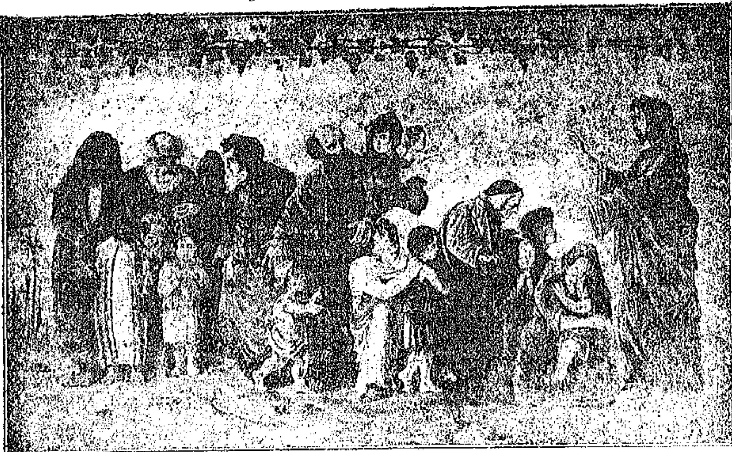
« ΑΦΕΤΕ ΤΑ ΠΑΙΔΙΑ ΕΛΘΕΙΝ ΠΡΟΣ ΜΕ ! »

« Η τοιχογραφία αυτή εξετελέσθη εν έτει 1895 εις τόν έν 'Αθήναις ναόν του 'Αγίου Γεωργίου Καρότη υπό τοθ κ. 'Αλεξ. Φιλαδελφώς. 'Ο άειμνηστος ποιητής Ι. Πολέμης, βαθύτατα εισδύσας εις τό νόημα της εικόνας και εις τό ύψηλόν της αναπαραστάσεως σκοπόν, έγραψε τότε τά εξής :